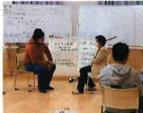
SST(ソーシャルスキルトレーニング) など