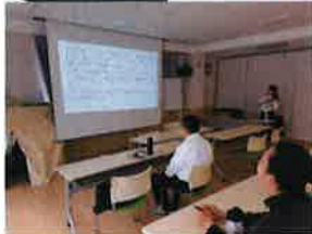
就労支援プログラム